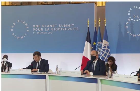
Emmanuel Macron en la Cumbre One Planet, el 11 de enero de 2021.

Survival lucha para que los pueblos indígenas se sitúen en el centro del movimiento de conservación de la naturaleza y los proyectos no se realicen en detrimento de ellos.