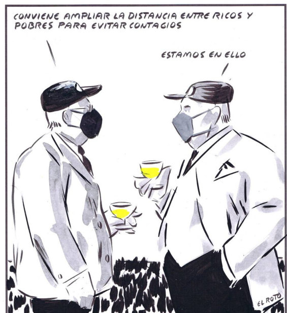
El Roto (El País)