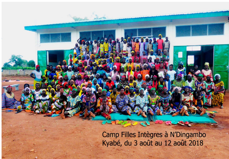
Camp Filles Intègres à N'Dingambo Kyabé, du 3 août au 12 août 2018